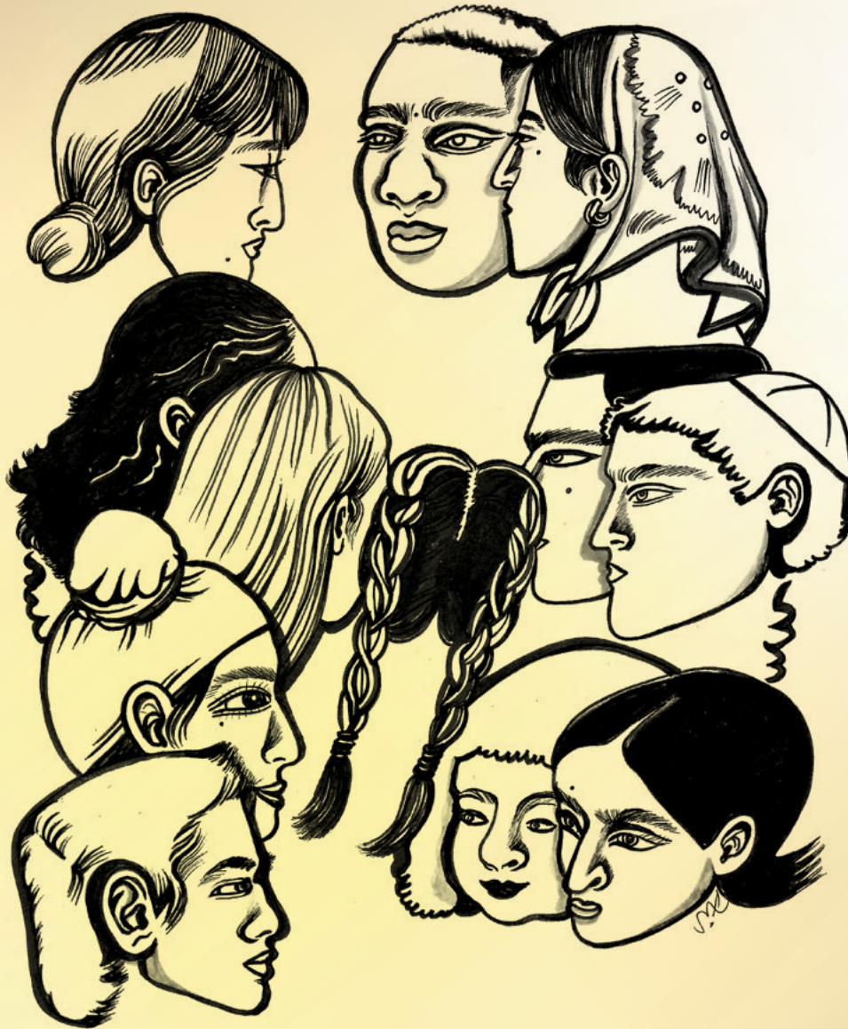
Illustration: Moshari Hlal